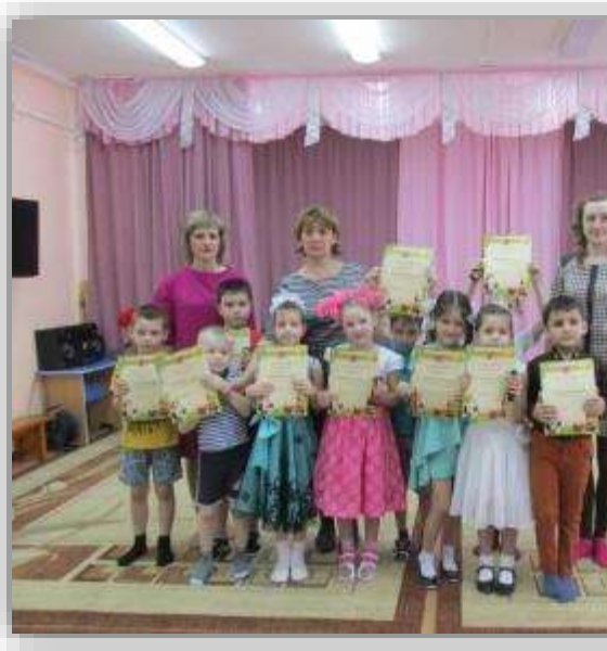
Награждение участников областного конкурса рисунков «Почетная профессия шахтера»