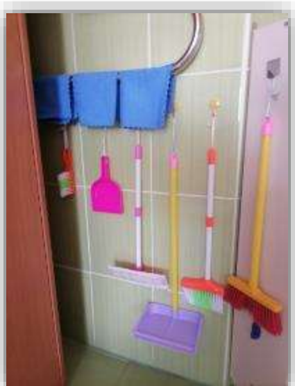
Центр хозяйственно-бытового труда.