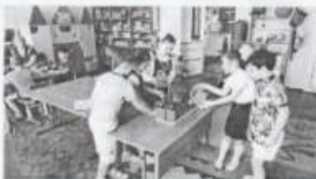
Тюнинские малыши ведут учет каждого нового появившегося листочка.